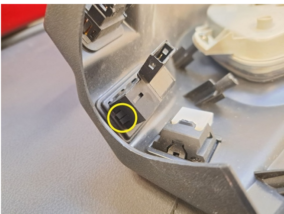
Irrota katkaisijat painamalla niiden sivussa olevia klipsuja ja samalla työntäen niitä ulos päin.