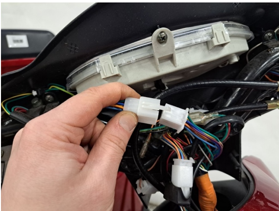
Avaa mittariston liitin.